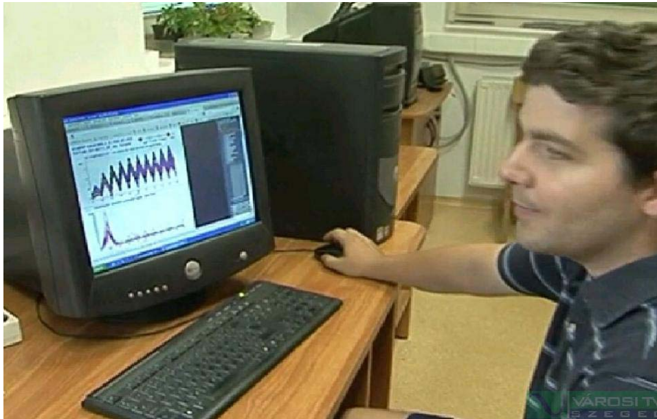
3. ábra: A Szegedi Magaslégköri Observatórium munkatársa éppen a távolabbi kilátásokról beszél a Szegedi TV-nek adott interjújában (2014. 07. 11.)

A Szegedi Magaslégköri Observatóriumnak a Bajai Televízióval és a Szegedi Városi Televízióval van szerződése. A Bajai TV-nek általában telefonon adunk tájékoztatást, ezért számukra csak hanganyaggal szolgálunk. A Szegedi TV az Observatórium helyszínén forgatja le a később a televízióban megjelenő kép- és hanganyagot (2. ábra). Természetesen a megkeresések mindig valamilyen szokatlan időjárási helyzethez kapcsolódnak. A Szegedi TV által készített riportban (3. ábra) lehetőségünk van bővebb tájékoztatást nyújtani, valamint friss, színes térképekkel, ábrákkal illusztrálni az elmondottakat.