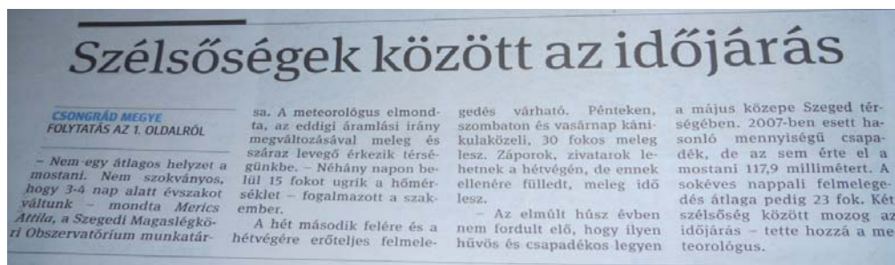
1. ábra: Cikk a Délmagyarország c. napilapból (2014. május 20., 104/116.)

Az OMSZ a Dél-alföldi régiót lefedő Délmagyarország c. napilap számára készít előrejelzési rovatot. Ezen kívül bizonyos időjárási események kapcsán (hóhullámok, rendkívül csapadékos helyzetek) a Szegedi Magaslégköri Obszervatórium munkatársai is adnak tájékoztatást az elmúlt napok időjárásának okairól, illetve természetesen a várható időjárásról is. Az adatszolgáltatást telefonon keresztül bonyolítjuk le, majd az elmondottakat másnap már olvashatjuk is a Délmagyarország -ban (1. ábra).