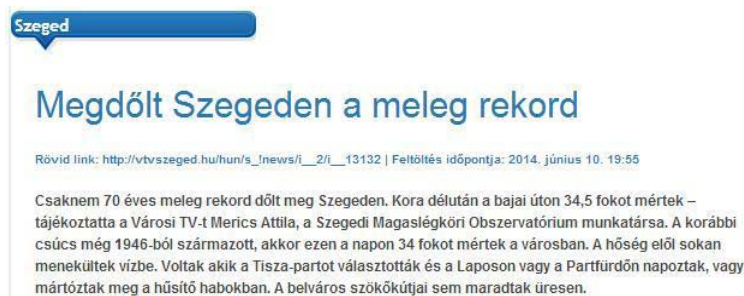
5. ábra: Tájékoztatás a melegrekord megdőléséről a Szegedi TV internetes lapján (2014. 06. 10.) ( http://vtszeged.hu/hun/s_!news/i__2/i__13132 )